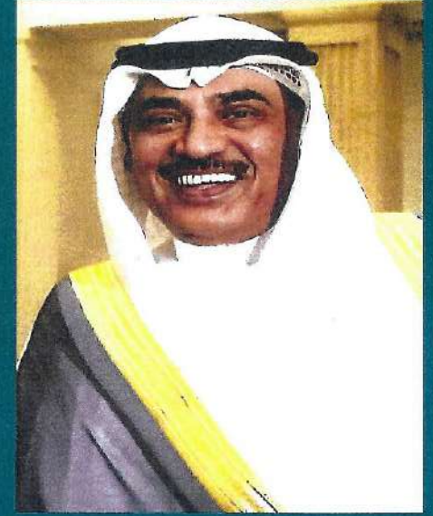
سمو الشيخ صباح خالد الحمد الصباح رئيس مجلس الوزراء

يتكون البرنامج من أربعة محاور رئيسية تتمثل في (1) تنفيذ برنامج استدامة (2) إعادة هيكلة القطاع العام (3) تطوير رأس المال البشري (4) تحسين البنية التحتية وتوظيف الطاقات المتجددة، ويندرج تحت كل محور مجموعة من المبادرات التنفيذية ببرامجها الزمنية والمستهدفات والمؤشرات والمسئوليات ويتم متابعتها بصفة دورية عبر حوكمة محددة بإشراف لجنة برنامج عمل الحكومة التابعة لمجلس الوزراء.